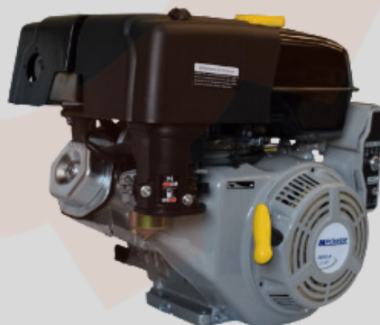
MOTOR A GASOLINA